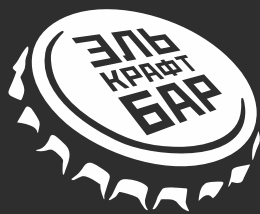
ЭЛЬ КРАФТ БАР